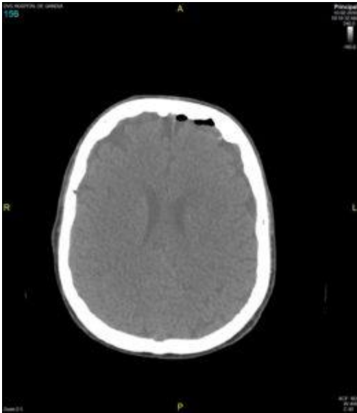
Fig. 1: TAC inicial. Se aprecian pequeñas áreas de neumocéfalo subaracnoideo en región frontal izquierda

En la TAC de control realizada a las 48 horas del evento se evidenció pequeña área hipodensa cortico-subcortical frontoparietal derecha de nueva aparición (fig 2 y 3), compatible con infarto agudo en territorio de arteria cerebral media derecha, junto con evidente mejoría del neumocéfalo, quedando tan solo alguna burbuja frontal izquierda.