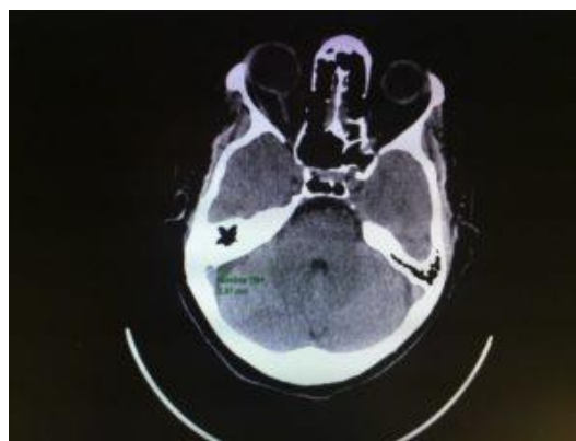
FIG 2: TAC craneal muestra higroma pericelebeloso derecho

Dada la recurrencia de las crisis, se decide intubación orotraqueal y traslado a Unidad de Cuidados Intensivos (UCI) neurotraumatológicos.