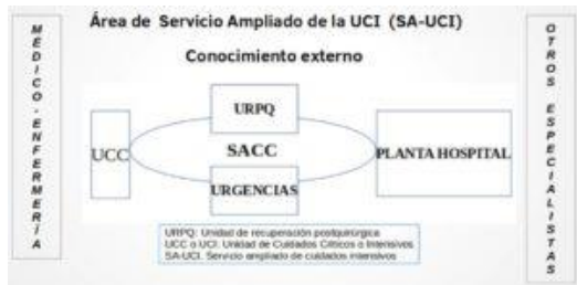
Fig. 2: Área de influencia del SA-UCI

Además aporta el conocimiento externo , tanto de los pacientes beneficiarios de una atención intensiva precoz, como los resultados finales de los pacientes atendidos: mortalidad precoz, vivos al alta del hospital, etc.