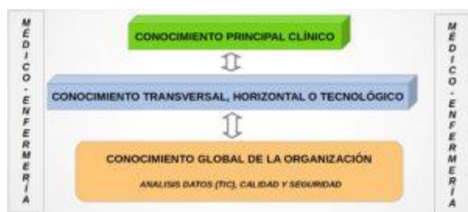
Fig. 1. Esquema integral de la gestión del conocimiento en una Unidad de Cuidados Intensivos