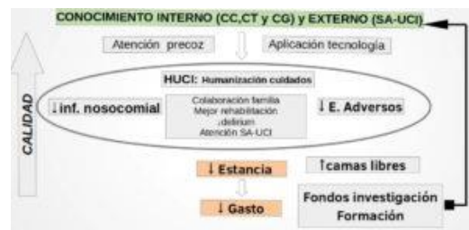
Fig. 4: Esquema del resultado final que produce la estrategia del conocimiento

conocimiento y propiciando un círculo virtuoso o ideal.