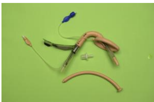
FIGURA: 1. Mascarilla Fastrach.

Este artículo presenta una revisión y puesta al día de las publicaciones más interesantes en los últimos 10 años sobre la Mascarilla Laríngea de Intubación Fastrach (MLF) (Fig.1). La MLF es un dispositivo supraglótico que permite la ventilación y la intubación a su través.