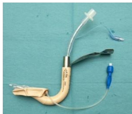
FIGURA: 4. TET de PVC curvatura al revés.