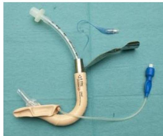
FIGURA: 3: TET de PVC.

- Se pueden usar varios tubos. De todos ellos, los que tienen más éxito de intubación son el de la MLF, con el inconveniente de ser de alta presión y bajo volumen. Por ello se aconseja usar el desechable de la MLF (baja presión y alto volumen) y también el de PVC (fig. 3) pero introduciéndolo en la MLF con la curvatura al revés (fig.4) ya que el ángulo de salida es menor y permite un porcentaje de intubación alto.