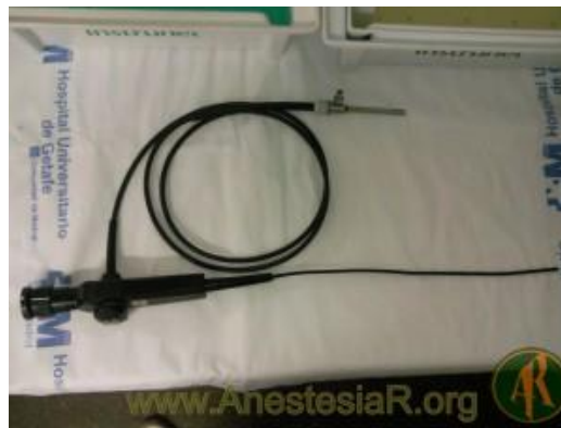
Figura 2.- Fibroscopio del Servicio de OR.

anestesta, para valorarla de forma conjunta, una Fibroscoopia Intranasal Preoperatoria (FBO de 2,7 cm. de diámetro y longitud de 35 cm.), confirmando las características anatómicas descritas en la fibroscoopia de la urgencia, pero sin edema y con visualización de las cuerdas vocales.