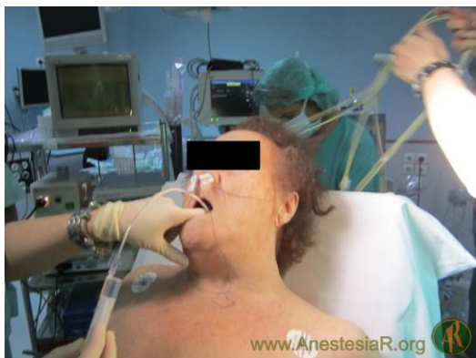
Figura 3.- Anestesia de hipofaringe