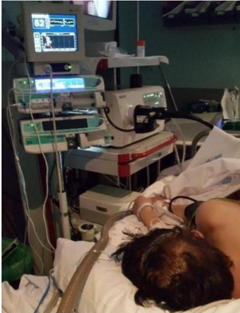
Fig. nº 2. Sedación con TCI + BIS en colonoscopia HUG.